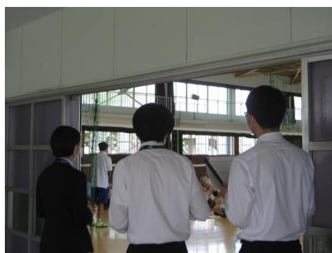
【社会科志望の三人】